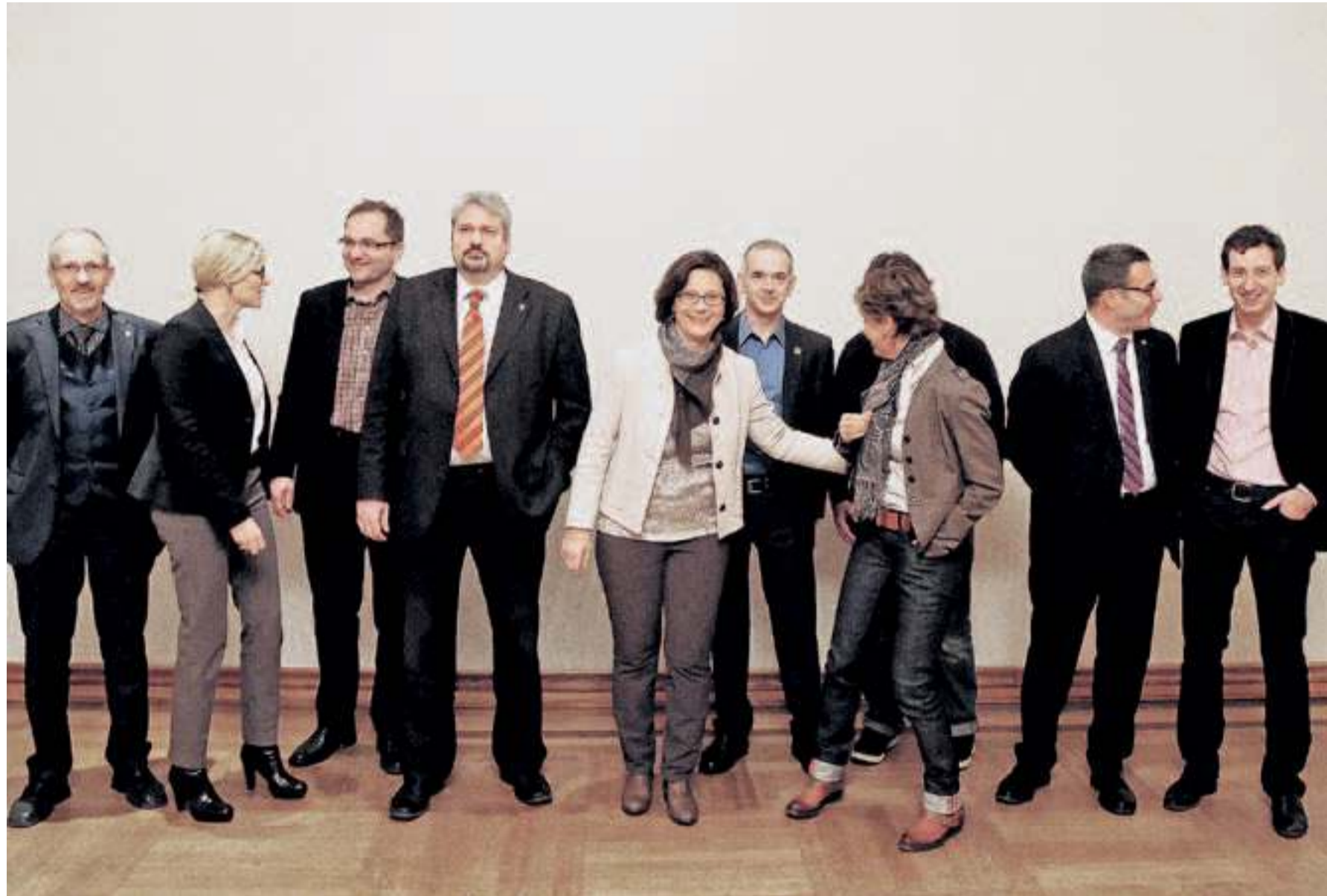
Nicht alle stehen im Vergleich zu ihrer Partei auch wirklich dort, wo man sie vermuten würde: die zehn Kandidatinnen und Kandidaten für den Stadtrat.